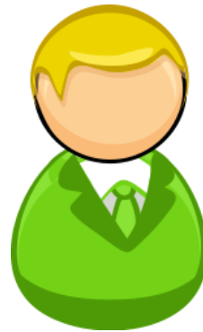
帳戶B 使用無痕或Inprivate模式